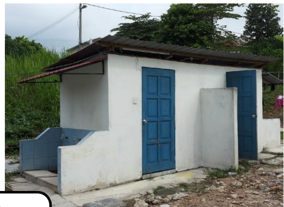
Tandas lama akan dirobohkan untuk pembinaan blok baru