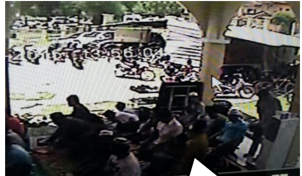
Jemaah Penuh hingga saf terakhir

Gambar-gambar dari Kamera Litar Tertutup Surau