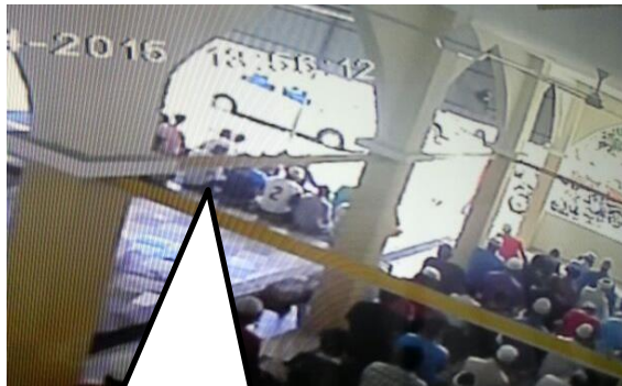
Jemaah solat di hadapan kawasan kolah

Dewan solat di tingkat bawah akan digunakan untuk menampung limpahan jemaah pada masa hadapan dan boleh juga digunakan untuk kelas-kelas atau bilik pengurusan jenazah. Ruang antara bangunan utama dan bangunan baru juga akan dipasang awning untuk menampung jemaah.