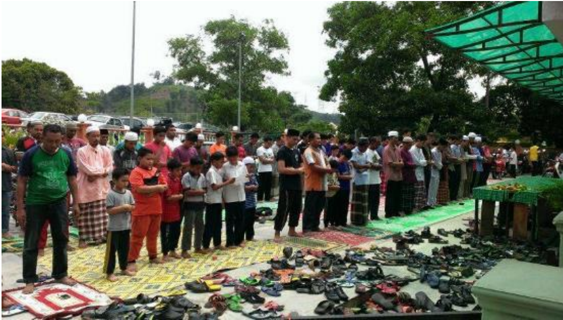
Gambar solat jumaat di surau solat jumaat paling hampir . Surau Nurul Iman sedang menunggu kelulusan mendirikan solat jumaat kerana keadaan jemaah yang terpaksa solat di luar kerana sudah penuh di surau paling dekat iaitu Surau al-ikhwan PUJ2 .