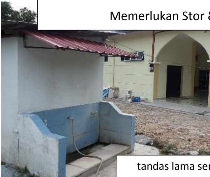
tandas lama sementara