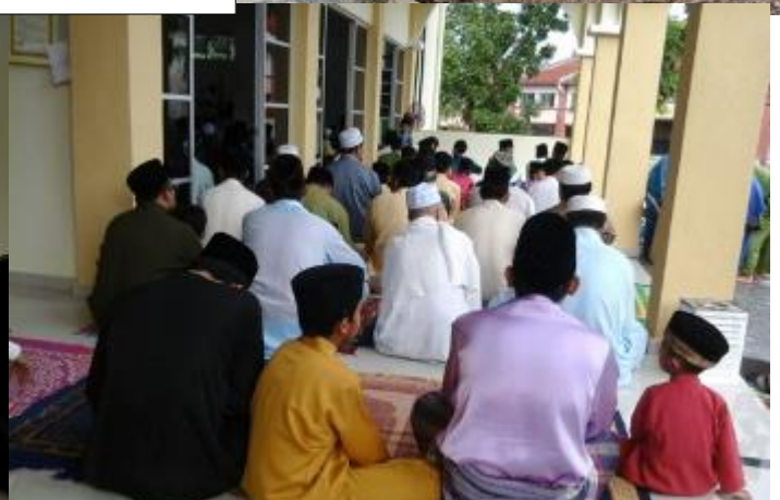
Jemaah yang ramai – solat raya