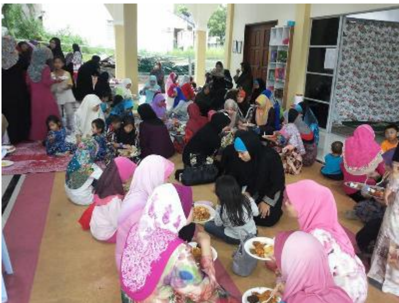
Setiap bulan ada sahaja aktiviti muslimin dan muslimat yang mendapat sambutan ramai di Surau Nurul Iman dan ini mendesak pihak surau untuk membina blok tandas baru.